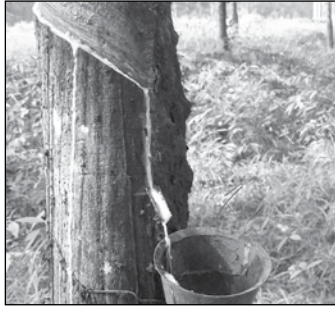
မရိုကြောင်း မြန်မာနိုင်ငံ ရော်ဘာစိုက်ပျိုးထုတ်လုပ်သူများအသင်းရဲ့ ဈေးနှုန်းထုတ်ပြန်ချက်အရ သိရှိရပါတယ်။

ဇူလိုင် ၇ ရက်မှ ၁၃ ရက်အထိ သီတင်းပတ်အတွင်း အမေရိကန်ဒေါ်လာ ၁ ဒသမ ၄၆၂ သန်းတန်ဖိုးရှိ ရော်ဘာ ၁၁၅၇ တန်တင်ပို့ခဲ့ရာ မူဆယ် (၁၀၅)မိုင်ကုန်သွယ်ရေးဇုန်မှ RSS-3 အမျိုးအစားတန်ချိန် ၇၀၀ နဲ့ MSR-20 အမျိုးအစား ၂၅၈ တန်၊ ချင်းရွှေဟော်ကုန်သွယ်ရေးစခန်းမှ RSS-3 အမျိုးအစား ၄၉ တန်ခန့်နဲ့ တာချီလိတ်ကုန်သွယ်ရေးစခန်းမှ Rubber Later 60% DRC တန်ချိန် ၁၅၀ တင်ပို့ခဲ့တယ်လို့ သိရပါတယ်။